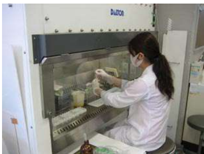
検体塗抹の様子 検体の塗抹は安全キャビネット内で行います。

喀痰や尿、体腔液、穿刺液などは、多くの場合、当検査センターの細胞診検査室にて標本作製します。喀痰はスライドガラスを数回軽く擦り合わせて伸展させ、液体状の検体は遠心分離によって細胞成分を集めてから塗抹します。血液成分の多い場合は、沈渣上部の有核細胞層を使用します。塗抹の際は、細胞成分を壊さないように擦り合わせる回数に気をつけるほか、鏡検に適した厚みになるよう、検体の量にも注意します。この場合にも、できるだけ速やかな固定作業が必要であることはスライドガラスでご提出の場合と同様です。