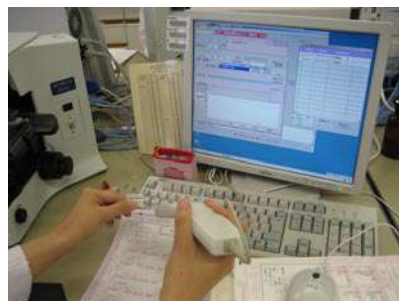
バーコードによる検体管理

今後もより安全かつ安心していただける検査体制づくりを目指して取り組んでまいりますので、よろしく願いいたします。