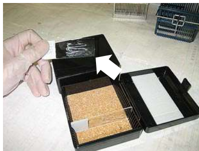
固定液をかけたスライドガラス 塗抹面が膜を張ったように見えます。

検査材料によっては、乾燥固定の標本でも表面に固定液がかかったように見える場合があります、判断に迷うときがあります。（右写真参考） したがって、検査材料をご提出の際には、固定液をかけた「湿固定」標本（パパニコロウ：Pap染色用）か、冷風にて乾燥固定させた「乾燥固定」標本（ギムザ染色用）かを明記していただきますようお願いいたします。