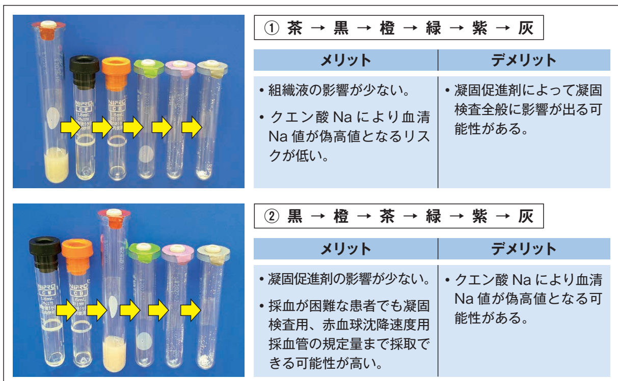
図1 真空管採血における採血順序