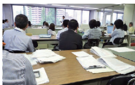
▲検査センター営業課（営業推進係、集配営業係、コールセンター）室

*平成26年8月をもって、業務渉外課集配係から「営業課集配営業係」へと改めました。