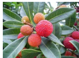
楊梅(ヤマモモ) (参考資料6より)

梅毒という名前の由来ですが、第2期 ※次頁の表参照 （感染後3か月～3年）に全身に出現する赤い発疹や丘疹が楊梅（ヤマモモ）の果実に似ているので楊梅瘡（ヨウバイソウ）と呼ばれていたようです。そのうちに「楊」の字がとれて「梅瘡」→「梅毒」と変化し、現在に至っているそうです。